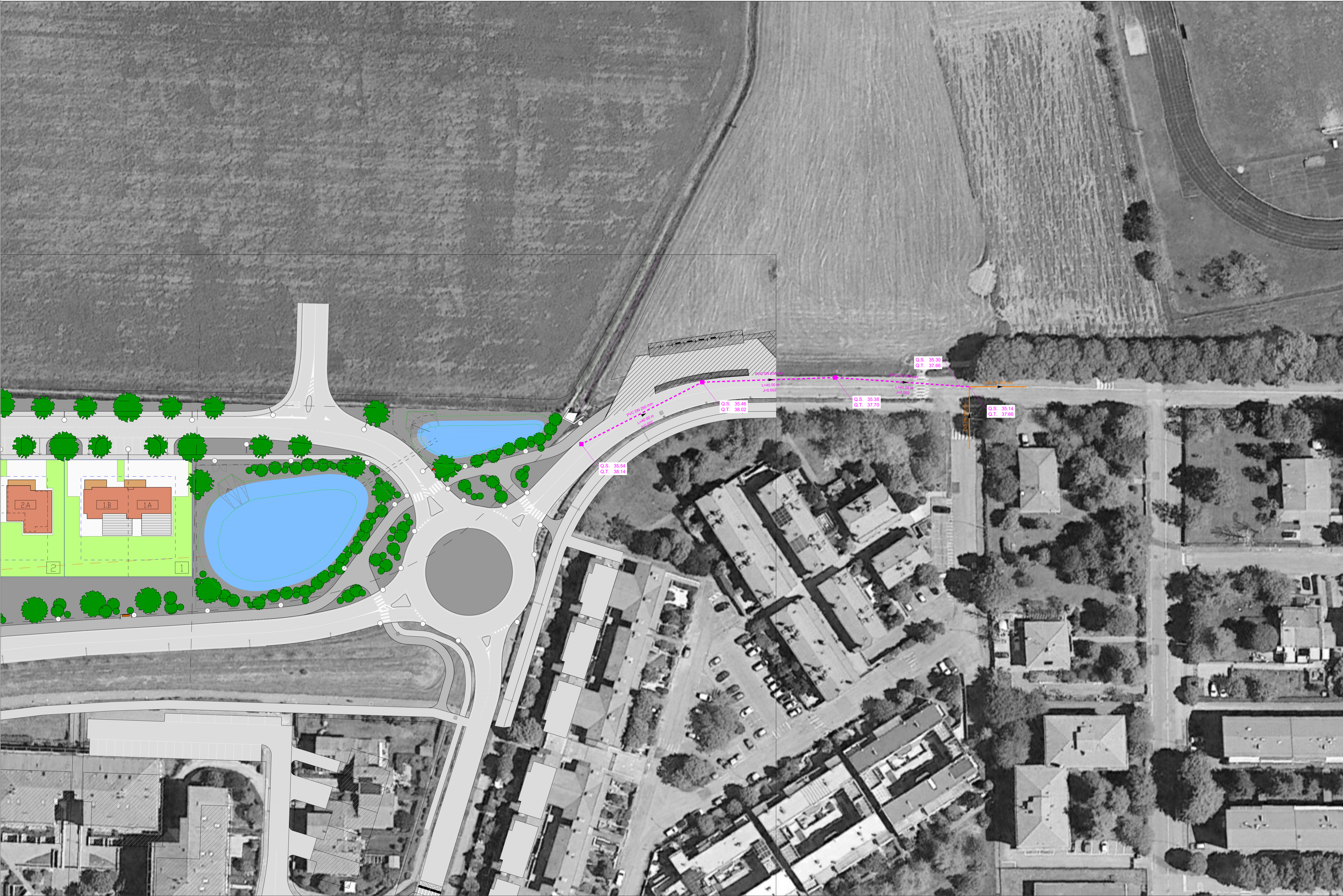
Planimetria opere di urbanizzazione extracomparto rete nera - Scala 1:500